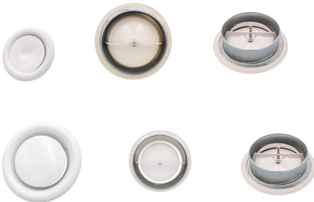
Valvole di ripresa / Return valves