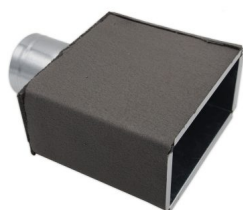
Attacco posteriore Rear connection