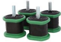
MONTAGGIO SU STAFFA